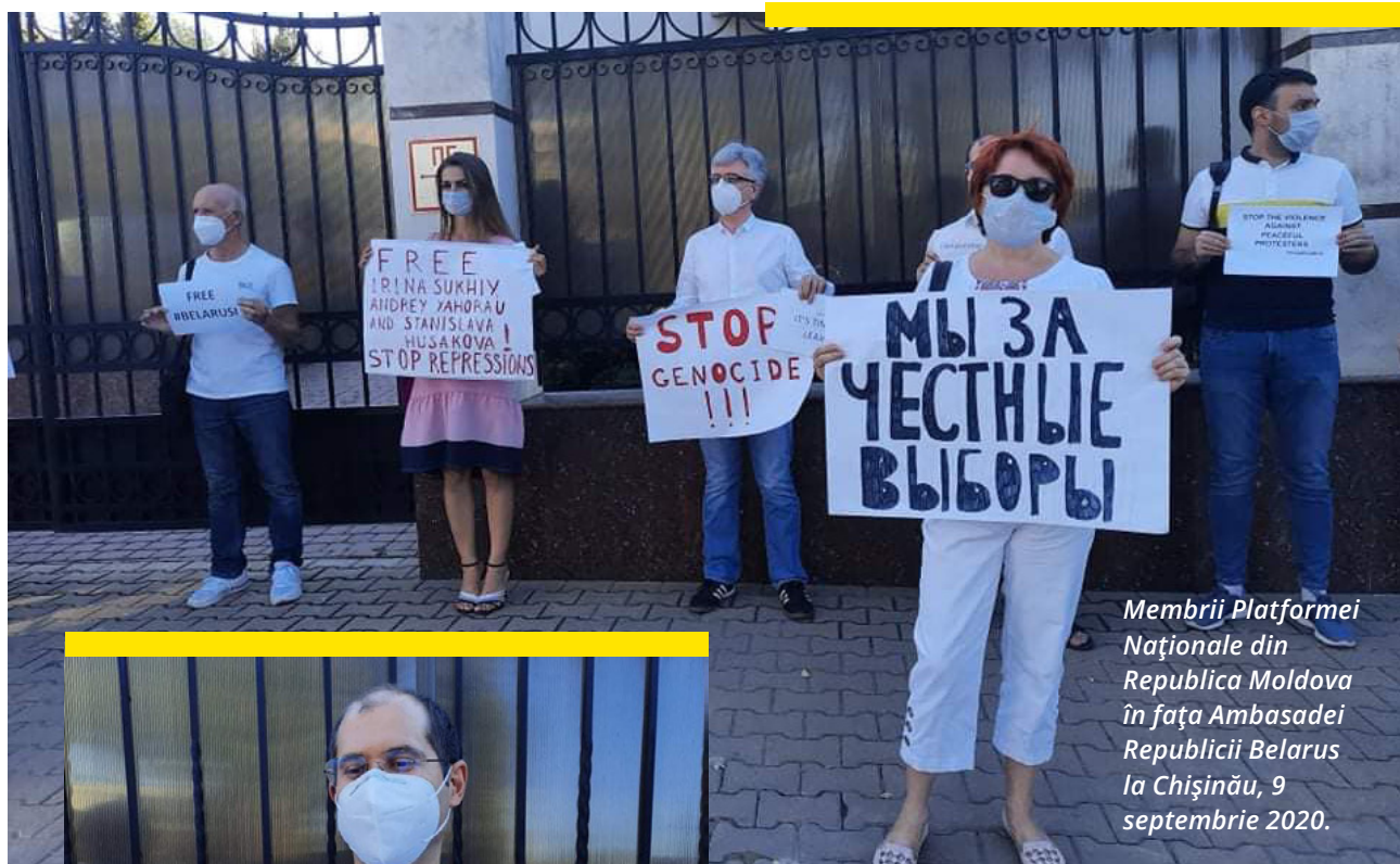
Membrii Platformei Naționale din Republica Moldova în fața Ambasadei Republicii Belarus la Chișinău, 9 septembrie 2020.