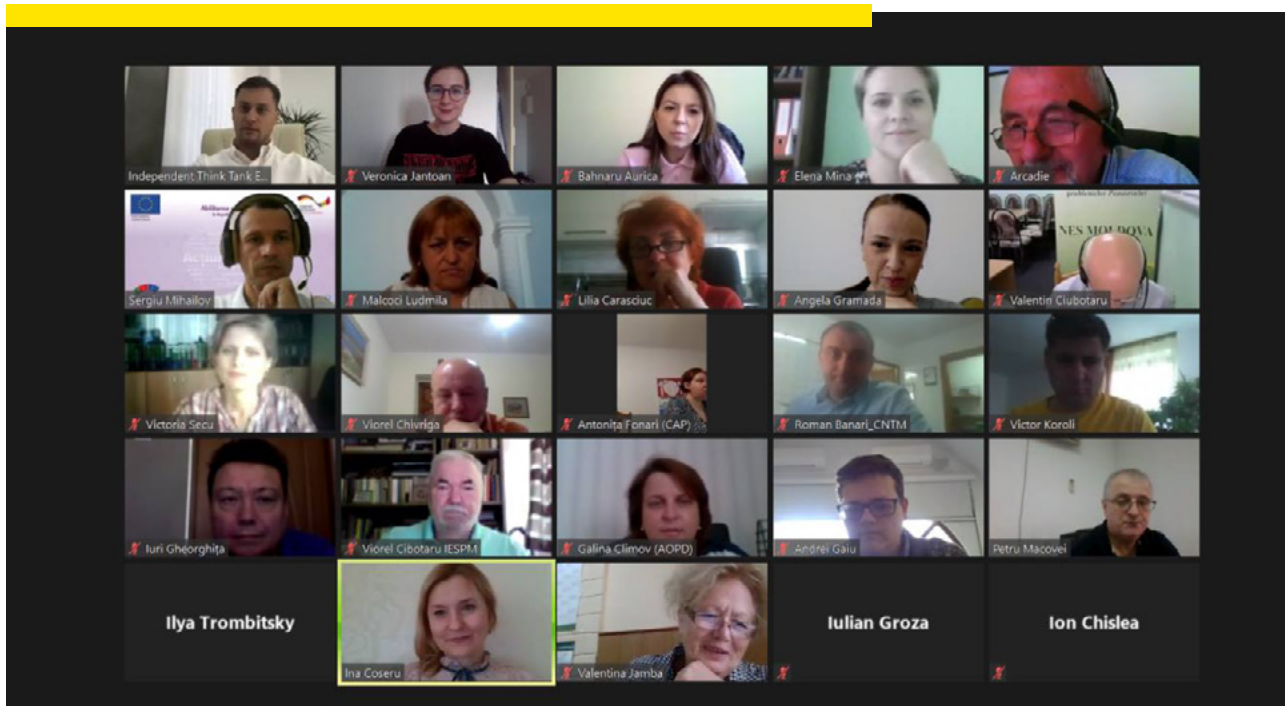
O parte dintre membrii Platformei Naționale a FSC din PaE în cadrul ședinței online din 18 septembrie 2020

Totodată, membrii au discutat despre strategia de advocacy a Platformei pentru 2020-2021 și au stabilit prioritățile Platformei, în concordanță cu Agenda de Asocieri dintre UE și Republica Moldova.